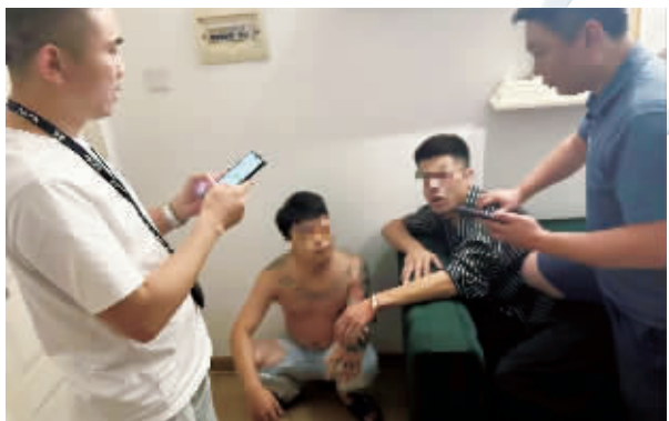
近日,民警据自首男子提供的情况抓获多名嫌疑人。

警方提醒市民,利用自己的银行账户为不法分子“跑分”是违法行为,大家不要出租出借出售或购买任何形式的个人金融账户,包括银行卡、网上银行、手机银行、“云闪付”二维码、支付宝、微信支付二维码等各类具有收款、付款、转账等功能的实名账户。随时注意保护个人隐私信息,不要轻信被网络上的高额利润所诱惑,一旦被不法分子用于诈骗、网络赌博或其他违法犯罪,不仅自己会成为犯罪“帮凶”,还将被依法追究法律责任。