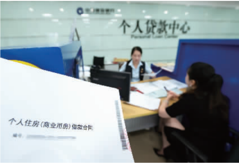
8月21日,江苏省海安市一家银行的个人贷款中心工作人员为客户办理个人贷款业务。

记者8月21日从湖南省森林防灭火指挥部办公室获悉,即日起,湖南省森林火情火灾报警工作由各级消防救援机构承担,森林火灾报警电话由原来的“12119”统一为“119”。 据介绍,统一使用接处警电话后,湖南省各级森防办纳入同级119指挥调度系统,便于消防救援机构接到相关报警后,同步推送警情信息,必要时可采取三方通话,湖南省森防办将停止全省12119报警系统运维保障。 湖南省森防办表示,各级消防救援机构接到森林火情火灾报警后,应第一时间将报警信息推送给同级森防办,指导做好森林火情早期处置。各级森防办接到消防救援机构发来的森林火警信息后,要迅速分送至同级应急管理部门、林业主管部门、公安机关和火情发生地的乡镇政府、街道办事处党政办公室。 ■均据新华社