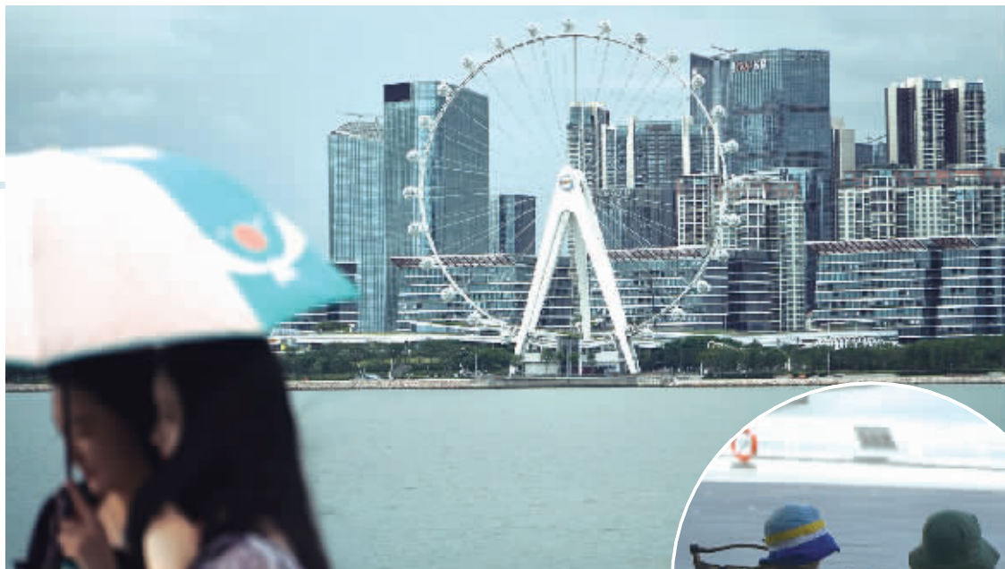
未伏酷暑难耐,市民周末仍在市区景点游玩。