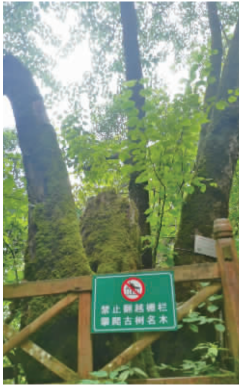
天平山珙桐湾的“珙桐王”。