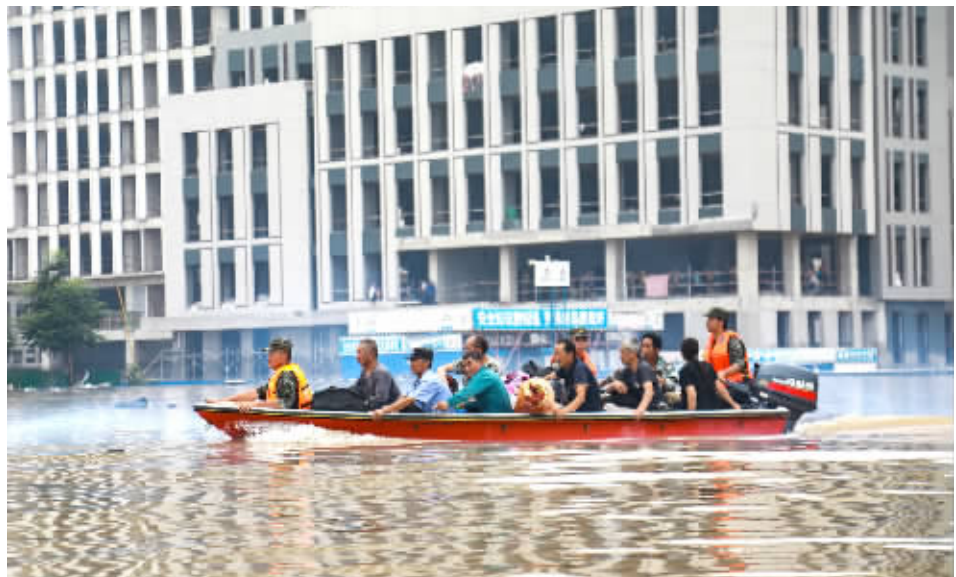
8月4日,武警河北总队官兵在涿州内涝区域驾舟转移受灾群众。新华社 图