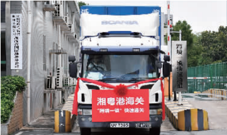
6月13日，一车出口邮件经长沙海关监管放行启运香港，这标志着湘粤港海关“跨境一锁”快速通关启动。