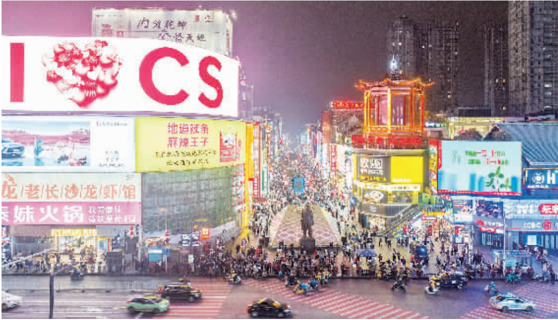
3月21日晚,长沙市黄兴路步行街流光溢彩,人头攒动,一派热闹景象。

宁乡市各景区节会活动精彩纷呈,长沙方特国风音乐节、炭河古城花痴节、湘都生态园露营非遗潮玩、关山古镇穿汉服游古街、稻花香里农耕文化园亲子微度假等活动,给你不一样的身心享受;灰汤紫龙湾泉水乐园开园,多种水上游玩项目惊险刺激,开启解压释放模式。