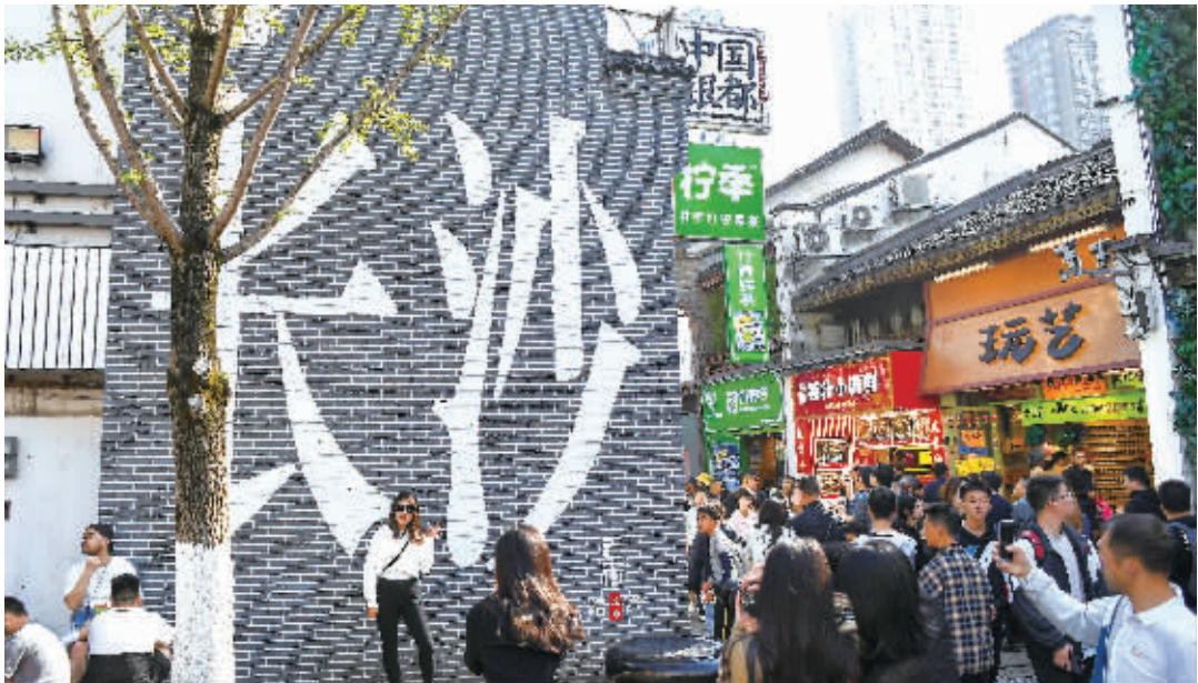
今年以来,长沙各大景区景点、历史文化街区、商场、饭店及具有浓郁长沙味的产品受到广泛追捧,文旅市场持续火热。图为市民和游客在太平街游玩打卡。

据悉,按照省委省政府部署要求,省教育厅这两年积极向教育部对接,厅领导带队赴省外160多所高水平大学走访,积极争取本科招生计划特别是省外高水平大学的招生计划,进一步加强省内高校招生计划执行管理,为三湘学子读本科特别是读高水平大学争取了更多机会。同时,为进一步促进公平,加大对农村和脱贫地区支持力度,在巩固拓展脱贫攻坚成果同乡村振兴有效衔接期内,湖南将继续实施面向农村和脱贫地区招生的国家专项计划、高校专项计划和地方专项计划,将优质教育资源向农村和脱贫地区倾斜。 省教育厅特别强调要重点实施好高校专项计划。承担高校是原自主招生高校,都是最优质的本科资源。高校分配计划的主要依据是各省的有效报名人数,只要报名人数越多,分到的计划越多,录取的人数相应就越多。比如,去年湖南报名人数较上年翻番,最后实际录取人数也增多了近一倍。今年高校专项计划报名截止日期是4月25日,51个县市区一定要抢抓最后关键时间,加大工作力度,尽可能发动更多学生报名。 此外,关于考试招生录取各环节工作,湖南将加强对中学的监管,严肃查处高中教师违规误导考生、有偿招生、买卖生源等违规行为,各高校要将招生考试自律机制建设作为学校内涵发展的重要内容,切实规范招生行为。 5月底前完成考点智能安检门安装 会议指出,湖南将进一步健全从考试命题、制卷,到试卷流转保管环节,到组考、评卷与成绩管理等各个方面的规章制度,确保每一个环节都有章可循、有规可依。同时,充分运用现代技术手段加强对保密、监考等关键岗位的实时监控,进一步发挥考场视频录像审看、巡视督考等机制的作用,主动接受社会监督,形成横向到边、纵向到底的监督监管体系。 今年,湖南还将继续组织开展“高考志愿大讲堂”等系列公益活动,各级教育部门、招考机构和学校将及时全面发布考试招生信息,认真做好志愿填报指导、来信来访接待等工作,尽力满足考生和群众的合理诉求。 同时,湖南将重点规范教育培训。招考期间,有些机构往往对高校“明码标价”,连哄带骗声称“包进”“包过”,严重损害教育形象、侵害学生家长利益。针对线上线下涉考环境,湖南着力防范和打击失密泄密、销售作弊器材、高科技团伙作弊等违法犯罪行为,始终保持对不法分子的高压态势。 此外,湖南将继续强化作风纪律保障,在考试招生工作和日常管理中严格依法依规办事,绝不能踩红线、触底线。5月底前完成考点智能安检门安装工作,进一步筑牢考试安全屏障。 ■三湘都市报全媒体记者 杨斯涵 黄京 通讯员 雷海燕