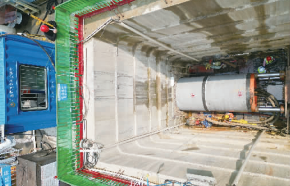
4月11日,长沙市芙蓉区红旗渠水系排水改造项目一处深基坑工作井俯瞰图。