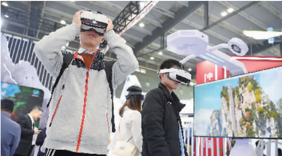
4月7日,参会人员在体验人力资源服务创新成果展。当天,湖南省第一届人力资源服务业发展大会开幕式在长沙国际会展中心启幕。