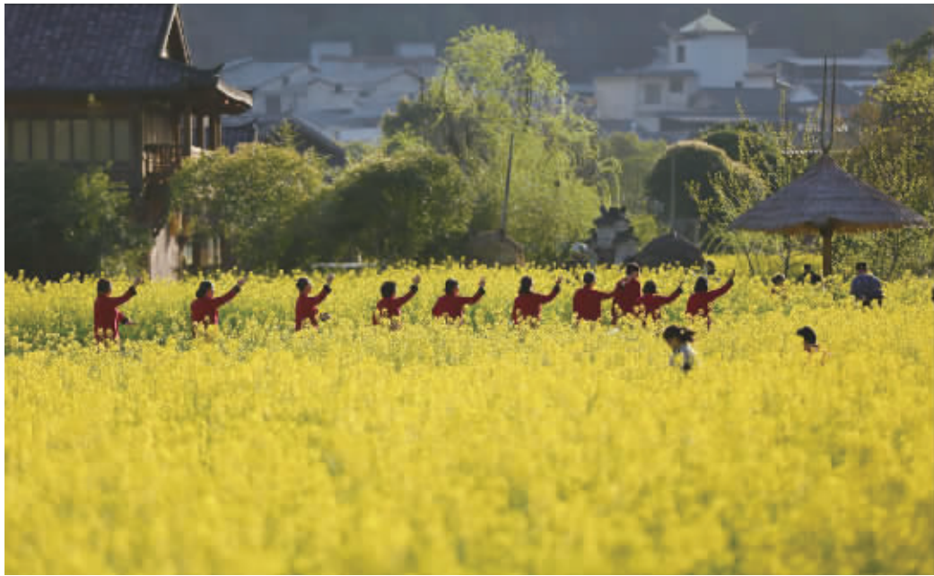
3月13日，太极爱好者在张家界武陵源区黄龙洞景区的花海田园间练习太极。