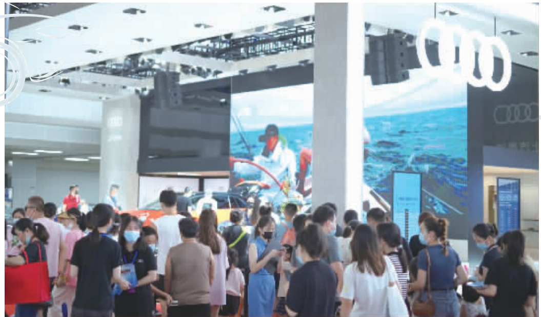
往届车展图。

4月28日至5月3日,2023湖南车展将在湖南国际会展中心(长沙世界之窗旁)盛大举行。本届车展以“车享美好生活”为主题,现场将不仅是一个车企展示品牌形象、车商卖车、消费者买车赏车的大舞台,还将被打造成网红长沙的体验馆。