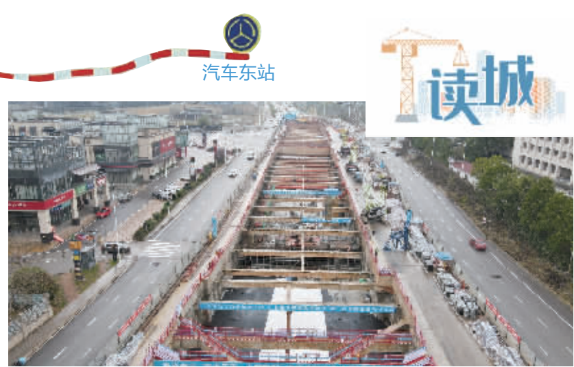
▲3月9日,长沙市轨道交通7号线一期云塘站施工现场。