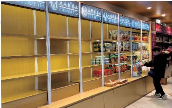
2月28日,华润万家V+城市超市内近半数货架的商品均已售罄。门店公告将于3月16日关闭。