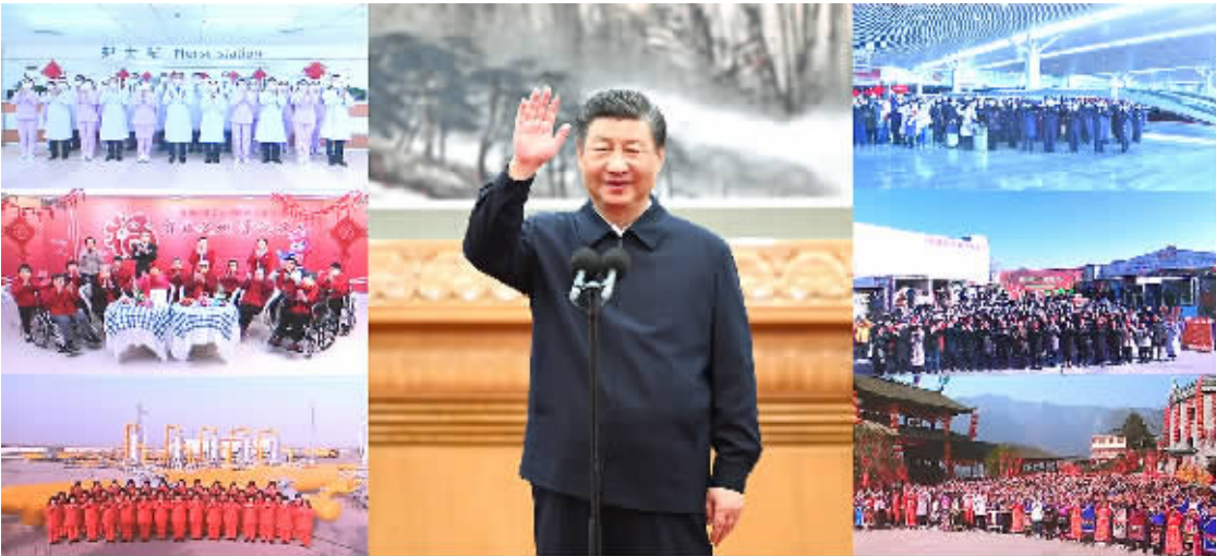
1月18日,中共中央总书记、国家主席、中央军委主席习近平在北京通过视频连线看望慰问基层干部群众,向全国各族人民致以新春的美好祝福(拼版照片)。

临近春节,神州大地处处洋溢着节日的喜庆气氛。1月18日上午,习近平在人民大会堂东大厅,同黑龙江、福建、新疆、河南、北京、四川等地基层干部群众视频连线,看望慰问防疫一线的医务人员、福利院的老年朋友、能源保供企业的员工、高铁站的干部职工、农产品批发市场的商户和群众、乡村基层的干部群众,给大家送去党中央的关心和慰问。 习近平十分关心新冠疫情防控和患者救治工作,他首先同黑龙江省哈尔滨医科大学附属第一医院视频连线,同医护人员和住院患者亲切交流,详细询问防控措施优化调整后发热门诊接诊、重症救治、药品配备和患者康复等情况。当医院院长说“急症、重症患者数正在下降,病房、床位充足,药品准备充分”时,习近平很欣慰。接着,习近平同一名住院的老年患者亲切交流,当得知患者病情明显缓解、即将出院时,习近平祝他早日康复出院,回家欢欢喜喜过年。他指出,新冠疫情暴发以来,特别是这一波疫情来势凶猛,广大医务工作者一直在防控疫情和日常治疗两线作战,长时间高强度、超负荷工作,为确保人民生命安全和身体健康作出了重大贡献。习近平代表党中央向全国广大医务工作者致以新春的祝福。他强调,近三年来,我们对新冠疫情严格实行“乙类甲管”,是正确的选择,经受住了多轮病毒变异的冲击,最大限度降低了重症率和病亡率,有力保护了人民群众生命安全和身体健康,也为优化疫情防控措施、实施“乙类乙管”赢得了宝贵时间。现在疫情防控进入新阶段,依然在吃劲的时候,但曙光就在前头,坚持就是胜利!目前,防控重心已经从防感染转移到医疗救治上来,重点是保健康、防重症,医院承担的任务更为繁重。要进一步扩充医疗资源,增加医疗服务供给,增加药品配备,特别要做好重症救治的应对准备,保障正常医疗秩序。要加强医护人员自身防护和关心关爱,确保他们身体健康。各级党委和政府要始终坚持人民至上、生命至上,坚持科学防治、精准施策,切实做好重点机构、重点单位、重点人群的防控,统筹各种医疗资源,保障好群众的就医用药需求,补齐农村地区疫情防控的短板。 视频连线镜头切换到福建省福州市社会福利院,在院老人和护理人员纷纷向总书记问好,习近平给大家拜年。他仔细询问福利院生活和医疗条件、疫情防控和老年人疫苗接种情况,并同在院老人聊起身体状况、日常生活,嘱咐他们保重身体。当得知这里伙食品种丰富,药品储备充足,对有基础病的老人加强了日常健康监测,节前备足了年货,习近平十分高兴。老人们拿出亲手制作的剪纸“福”字,向总书记献上真诚的祝福,习近平表示感谢。他强调,当前,病毒仍在不断变异,这一波疫情虽然毒性有所减轻,但传播更快、传染性更强,对老年人风险很大,我特别关心关注老年朋友。老年人是当前疫情防控的重中之重,对养老院、福利院等机构人员防护和健康管理措施,要严于其他场所,严防发生聚集性疫情。养老院、福利院等要与医疗机构的配合,推进疫苗接种,完善防控和救治机制,确保重症患者及时得到救治。习近平指出,尊老爱老是中华民族的优良传统和美德。一个社会幸福不幸福,很重要的是看老年人幸福不幸福。我国社会老龄化程度越来越高,一定要让老年人有一个幸福的晚年,要大力发展养老事业和养老产业,发展公办养老机构和普惠型养老服务,特别要强化对特困、低保、高龄、失能老年人的兜底保障。要适当组织开展文体活动,丰富老年人精神文化生活,让老年朋友过一个欢乐、健康、祥和的春节。(下转A04版)▶▶▶