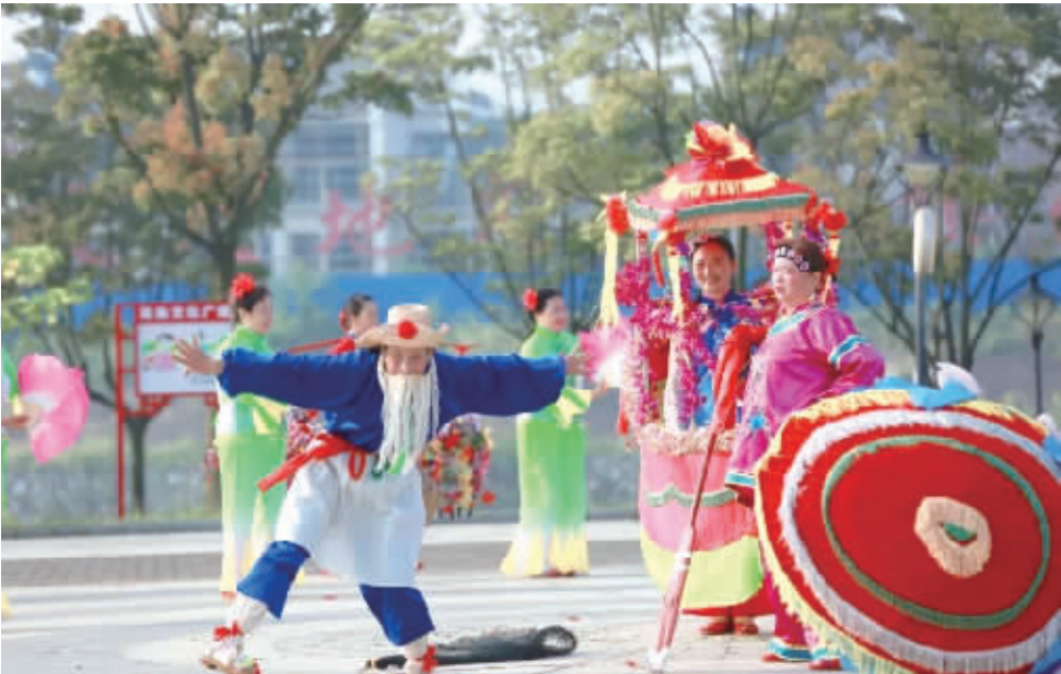
1月28日至2月5日，贝拉小镇非遗传承展带你重拾传统年味。

15日晚间，步步高还发布业绩预告称，预计2022年亏损13亿至19.5亿，同比下降606%—959%。关于业绩预亏的原因，步步高称，报告期公司进行了战略重大调整：除购物中心和百货店外，自去年四季度开始，通过关停并转从四川市场全面退出，江西市场大幅收缩至新余、萍乡、宜春三地（临近湖南的城市）；湖南、广西两省也同步关停并转低效亏损门店。上述调整造成了直接的资产损失和间接的商誉损失、所得税返还等多方面减少。同时，受疫情常态化影响，居民消费复苏缓慢。尤其去年四季度，公司十多个城市的门店被轮番封控，不仅客流急剧下降，公司还对部分商户实行租金反哺。上述因素叠加，导致了去年业绩同比下降较大。 不过，业内人士认为，伴随着湘潭国资入主、控制权变更，步步高所面临的经营环境将得到极大改善。一方面，当前疫情防控政策持续优化调整，从国家到地方稳增长政策陆续出台，我国居民消费快速恢复，经济的复苏预期持续增强。国资入主有助于公司轻装上阵，快速抓住政策机遇，打个翻身仗。另一方面，国资入主有助于供应商重拾信心，供应链将快速恢复正常。