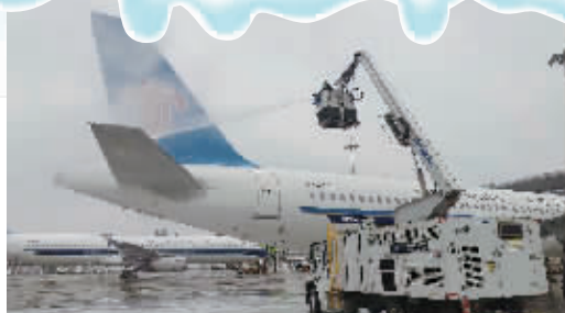
长沙气温骤降,南航给飞机“热身”。