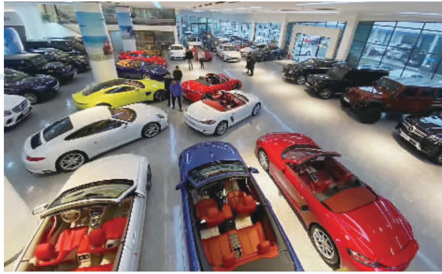
长沙某二手车展厅内。

春节快递真的不打烊？目前快递网点状态如何？12月25日，在长沙市开福区开福寺路一家快递分部内，仍坚守岗位的快递小哥戴着口罩在不停忙碌，“过年不回家的同事，都可以拿加班工资。在长沙安家、定居的快递员，会选择多赚点钱。” 据记者不完全统计，从2019年起，顺丰、邮政、中通、韵达等10余家快递企业均坚持“全年无休”服务理念。不过，按照往年的“惯例”，春节期间邮寄包裹可能会收取每件不超过10元的服务费。 如，2023年淘宝、天猫“春节不打烊”就将覆盖长沙、广州、上海等全国超300个城市，菜鸟将联合中通、申通、韵达等快递企业共同保障春节物流平稳运转。菜鸟有关负责人就介绍，2023年春节，菜鸟全国分拨、自营车队、小件员都将有人员留守，留守快递员将获得年前坚守红包、年中留守补贴，年后返岗补贴、年夜饭等一系列春节留守补贴。 此外，针对近期部分城市快递运力不足的现象，菜鸟已在全国站点启动临时运力补充计划，设立跨省调人等应急预案。