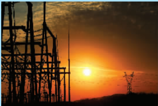
湖南怀化顶光坡高铁电力牵引变电站