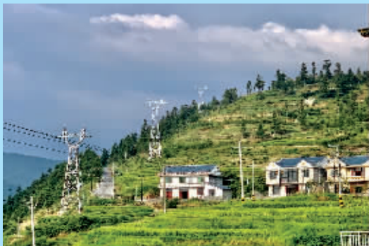
溆浦山背电网改造图景