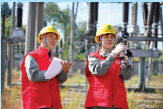
助力企业开展安全用电检查