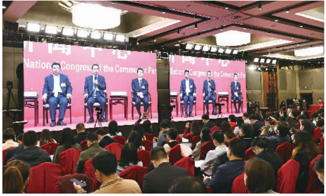
10月19日，党的二十大新闻中心在京举行第三场集体采访，湖南代表团新闻发言人、省委常委、省委宣传部部长杨浩东等7位代表团新闻发言人，分别介绍各自代表团学习讨论党的二十大报告情况，并回答记者提问。