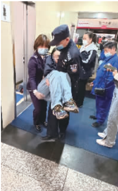
10月17日，长沙地铁公安民警在紧急情况下的“公主抱”，路人纷纷为之点赞。

三湘都市报10月18日讯 “有人晕倒了!”“站台洗手间有人晕倒了!需要帮忙!”10月17日8时20分，长沙地铁1号线黄兴广场站人头攒动，站务人员一阵高声呼喊，顿时引起了正在巡逻的长沙市公安局公安分局尚双塘派出所民警的注意。 民警们立刻奔向求助的站务人员。他们到达现场后，看到一名年轻女性乘客因突发疾病，侧躺在洗手间墙边，且无陪同人员，又值早高峰期间，情况十分紧急。 “发现乘客昏迷不醒、嘴唇发白、四肢发凉。”一名民警回忆说，他和同事们果断疏散围观群众，给救助腾出通道，自己在站务人员的协助下，一个“公主抱”将晕倒的乘客抱至站台长椅上，并拨打了120急救电话。现场，路过的群众纷纷点赞。 几分钟后，该名乘客意识有所恢复，但仍然非常虚弱，无法正常说话。为防止她失温，民警立即脱下制服外套，盖在其身上。没过多久，救护车赶到，民警和站务人员合力将她护送上救护车。 10月18日，放心不下的民警还特意给医院打去电话询问，听说乘客身体已无大碍，他们才放心来。 ■全媒体记者 杨洁规 通讯员 李娜 邵青