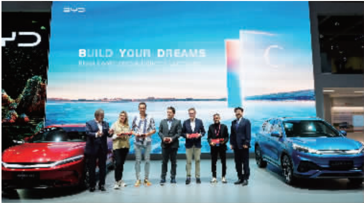
来自挪威、荷兰和以色列的比亚迪车主参与发布会和交付仪式。

10月17日，比亚迪携唐、汉、元 PLUS(当地车型名为 BYD ATTO 3)三款电动车型亮相巴黎车展，闪耀世界舞台。 比亚迪国际合作事业部兼欧洲汽车销售事业部总经理舒酉星表示：“把比亚迪新能源乘用车的最新技术和产品呈现给欧洲消费者，我们十分激动。凭借卓越的设计、领先的技术和优质的服务，比亚迪将不负欧洲消费者期望。我们高度尊重欧洲汽车工业及其行业生态，愿与当地优秀的经销商合作伙伴一起，为欧洲消费者提供优质的新能源产品与服务，共筑绿色梦想。” 比亚迪全球战略合作伙伴壳牌参与发布会，双方共同宣布将为比亚迪欧洲车主提供更优质的充电体验，包括向车主开放欧洲境内约30万个壳牌充电桩使用权。 壳牌集团全球零售业务执行副总裁柯一凡(Istv ́n Kapit ́ny)表示：“我们