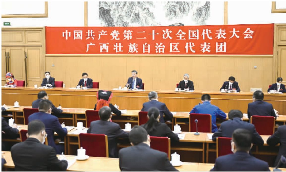
10月17日，习近平同志参加党的二十大广西代表团讨论。