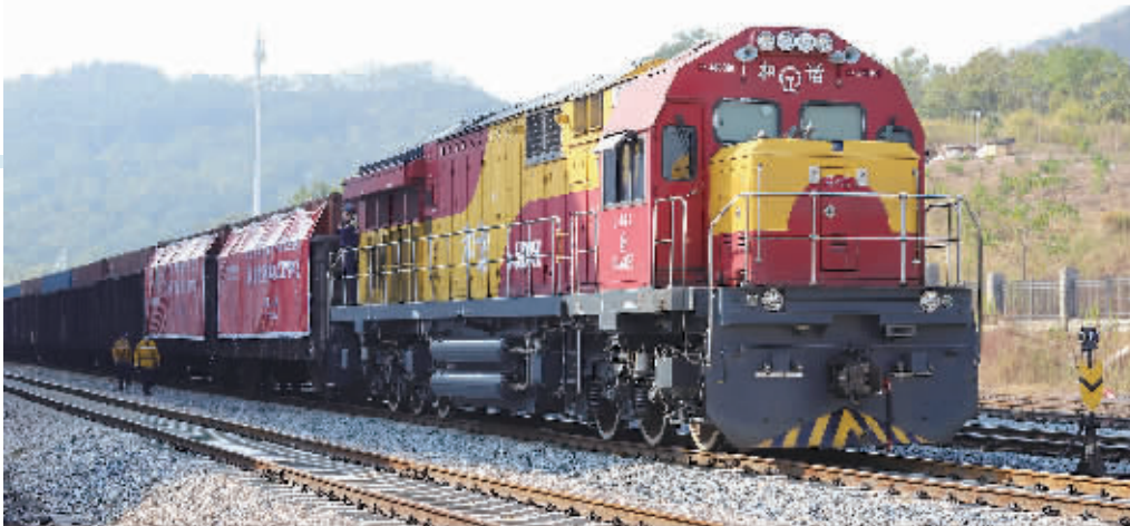
10月15日,由湖南钢铁集团有限公司生产的钢材搭乘专列从株洲驶出,将抵达泰国和马来西亚。

不过,如果主借款人的账户缓缴、欠缴2个月以上、封存、公积金贷款当前存在逾期的,不能申请变更还款方式和贷款期限。 此外,如果选择从异地中心转移到长沙住房公积金管理中心,可以选择窗口办理或网上办理。如果选择窗口办理,职工在长沙住房公积金管理中心设立住房公积金个人账户,并正常缴存住房公积金6个月以上,可至缴存管理部申请将在异地中心缴存的住房公积金转移到市公积金中心。 如果选择网上办理,职工在长沙住房公积金管理中心设立住房公积金个人账户,并正常缴存住房公积金6个月以上,登录中心官网网上业务大厅、微信公众号选择“个人异地转入”或全国住房公积金微信小程序选择“转移接续”,根据提示录入相应信息即可申请将异地的公积金转移至长沙中心。 ■全媒体记者 卜岚 视频 见习记者 王普