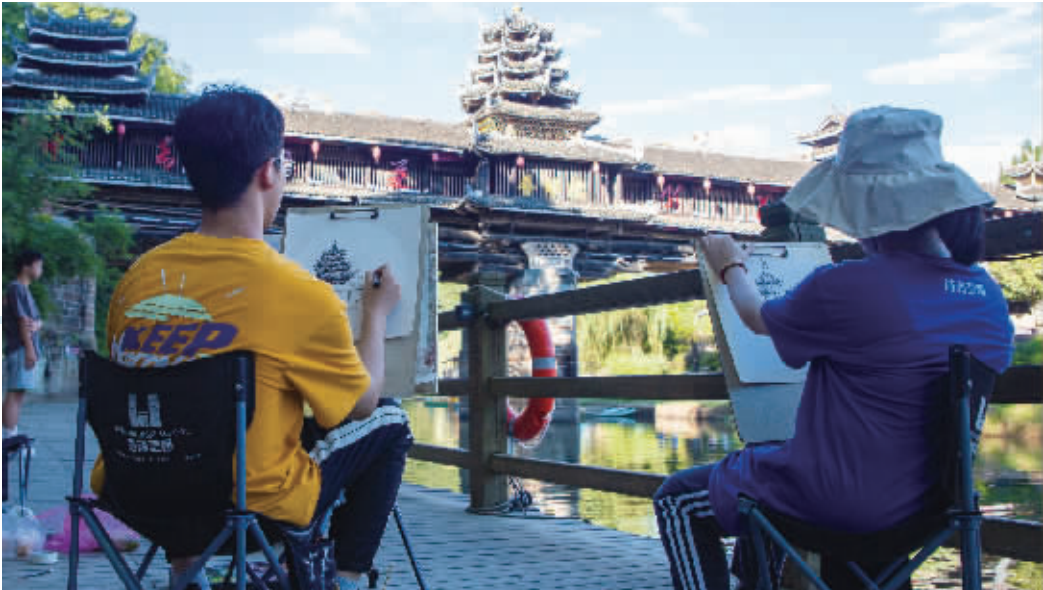
8月12日，游客在通道侗族自治县坪坦乡皇都侗寨写生。近年来，该县依托良好生态和民俗文化优势，积极完善“食、住、行、游、购、娱、学”等旅游要素，走出了一条民族文化遗产与文化创意旅游相融合发展之路。

习近平在回信中说，你们长年在山崖间清洁环境，日复一日呵护着千年迎客松，用心用情守护美丽的黄山，充分体现了敬业奉献精神。 习近平强调，“中国好人”最可贵的地方就是在平凡工作中创造不平凡的业绩。希望你们继续发挥好榜样作用，积极传播真善美、传递正能量，带动更多身边人向上向善，弘扬社会主义核心价值观，争做社会的好公民、单位的好员工、家庭的好成员，为实现中华民族伟大复兴奉献自己的光和热。 2008年起，中央文明办组织开展网上“我推荐我评议身边好人”活动，至今已发布“中国好人榜”150期，共有16228人(组)入选“中国好人”。李培生、胡晓春在黄山风景区分别从事环卫保洁和迎客松守护工作，2012年和2021年先后入选敬业奉献类“中国好人”。近日，李培生、胡晓春给习近平总书记写信，汇报工作情况和心得体会，表达了为守护美丽黄山、建设美丽中国贡献力量的决心。 ■据新华社