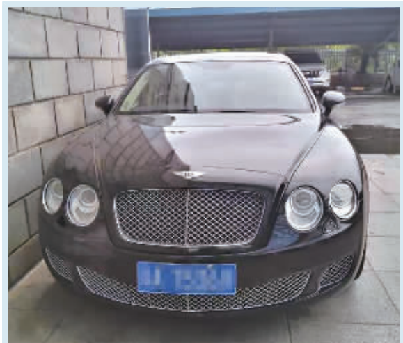
被扣宾利车价值百万元。

家长们该如何应对孩子的假期睡眠问题?专家进行支招。 运动让睡眠更好。白天进行适当的体育活动,可以提高孩子的睡眠质量。世界卫生组织(WHO)建议每周至少进行150分钟的中等强度体育活动,75分钟的剧烈运动,或两者兼而有之。 让孩子晚起一小时。一项来自英国牛津大学研究显示,青少年的身体机能每天正常运转要比成年人晚2小时,“让青少年早上7时起床,就好比让成年人早上5时起床”。比起一味提倡“早睡早起”,不如让孩子们早上多睡一会儿、吃早餐慢一点,才是提升身体素质和学习效率的王道。 睡前习惯很关键。研究表明,12-18岁青少年在晚上9时后,会同时接触至少4种电子设备,这些设备的使用都会让孩子更难进入睡眠。在睡前玩一些刺激大脑类的游戏,也会导致孩子的深度睡眠时间减少。因此,在睡前1-2个小时内尽量不要接触电子设备,有助于青少年的睡眠。