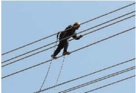
为确保项目按期交付,工人们正在加班加点作业。