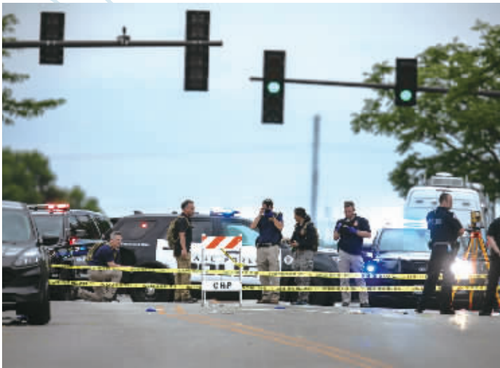
7月4日，警察在美国伊利诺伊州海兰帕克市的枪击现场取证调查。