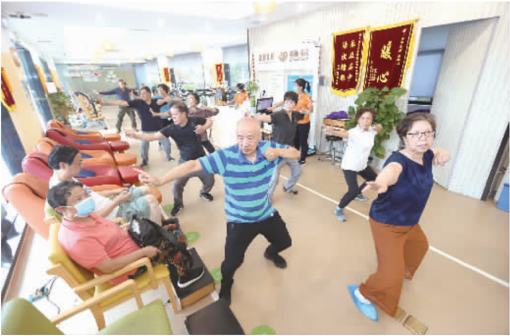
在上海市徐汇区康健街道的“长者运动健康之家”,老人们在健身后练习八段锦。新华社 图

省委财经委员会委员李殿勋、谢卫江出席。省有关单位负责人参加会议。 会议指出,党的十九大以来,习近平总书记多次主持召开中央财经委员会会议,深入研究了一批事关根本和长远的重大问题。我省认真贯彻落实中央财经委员会决策部署,在全面建成小康社会、打好“三大攻坚战”、提高科技创新能力、提升产业基础和产业链水平、畅通国民经济循环、做好碳达峰碳中和、推进共同富裕等方面积极作为、取得实效。 会议强调,要深入贯彻落实中央财经委员会第十一次会议精神,把基础设施建设摆在更加突出的位置,准确把握总体要求,积极抢抓政策机遇,清醒看到差距不足,坚持立足长远、适度超前、科学规划、多轮驱动、注重效益,聚焦网络型、产业升级、城市、农业农村、国家安全等五大领域基础设施建设,优化基础设施布局、结构、功能和发展模式,为建设现代化新湖南打下坚实基础。 统筹全省各类基础设施布局 会议强调,要统筹全省各类基础设施布局,加快构建现代化基础设施体系。要聚焦重点领域,立足我省实际,加强交通物流、能源保供等设施建设,因地制宜推进城市基础设施建设,抓好农业农村基础设施建设,加快战略物资储备、金融、网络安全等领域基础设施建设。要狠抓项目建设,加强项目储备,完善推进机制,强化项目管理,健全可行性研究和评估评审制度,加强项目调度,加快建设进度,确保工程质量和安全。要加大投入力度,加快投融资改革,拓宽资金来源,积极争取中央资金,用好专项债券资金,引导金融机构融资,加强与央企、外资合作,吸引社会资本投入,严禁违规举债。要强化支撑保障,加强用地、用能、用工、环评、原材料等保障,统筹协调好全省各领域、各地区基础设施规划和建设。 会议要求,要加强党对经济工作的领导,形成齐抓共管的工作合力。要紧紧围绕“六个重视”要求,不折不扣把中央决策部署落实到位,省委财经办要加强对重大财经问题研究,各级各有关部门要加强协作配合。要贯彻落实“疫情要防住、经济要稳住、发展要安全”重要指示要求,高效统筹疫情防控和经济社会发展,以实际行动迎接党的二十大胜利召开。 ■湖南日报全媒体记者 邓晶琰