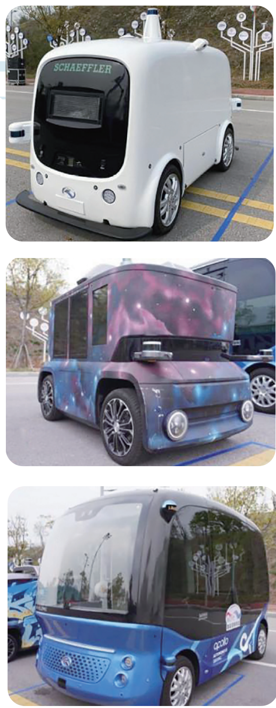
本次汽车黑科技体验周活动现场将展示、体验的部分车型。上：阿波罗无人零售车。中：舍弗勒城区物流车。下：无人小巴阿波龙。

连线 无人售货车、无人配送车、无人驾驶出租车……智能驾驶车队将在湖南车展集中亮相 近年，长沙在智能网联汽车领域发展迅速，不仅吸引了华为、舍弗勒、百度、中车等10余家世界500强企业，还聚集了算法、芯片、大数据、通信、导航等智能网联领域上下游企业360余家。去年，工信部“赛迪顾问”发布《2020中国智能网联汽车示范区评析》白皮书，国家智能网联汽车(长沙)测试区综合实力排名全国第一。目前，长沙已拥有无人售货车、无人清扫车、无人配送车、无人驾驶出租车等豪华的自动驾驶车队。 6月30日，记者从车展组委会了解到，这些无人车队计划在2022湖南车展亮相。“L4级低速无人零售车、无人快递车、无人清扫车等已应用于长沙的公园、景区、学校、工业园区等场景，以及疫情防控一