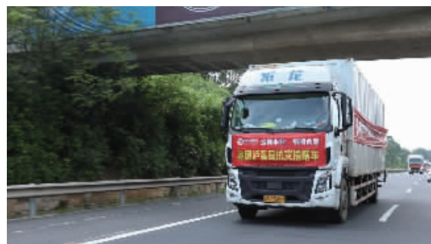
满载金健米业、裕湘食品三大挂车爱心物资直奔湘西驰援泸溪。