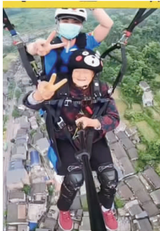
71岁的老人乘滑翔伞在高空开心地举起两个手指头比“耶”。 受访者 供图