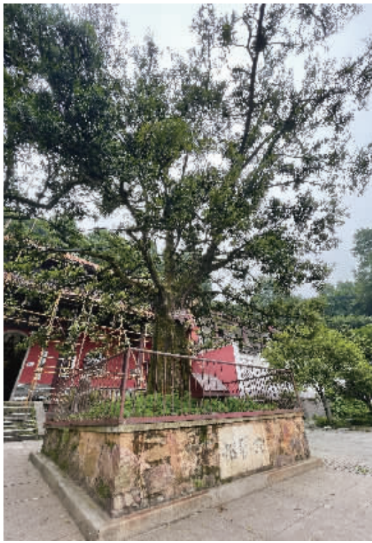
长沙岳麓山麓山寺观音阁前的“六朝松”。