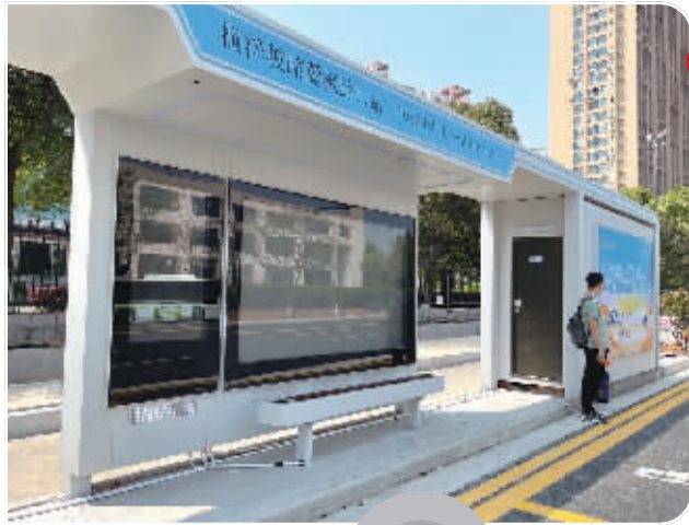
4月11日,正在建设当中的长沙市桐梓坡路麓枫路口公交站台。站台一侧配有公共卫生间。