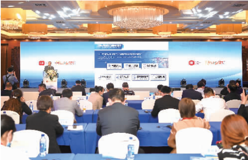
3月16日，嘉宾在进行湖南省工程机械产业推介。当天，阿联酋迪拜世界博览会中国馆湖南活动周在长沙举行开幕式。

近日，新华社记者就房地产税改革试点问题采访了财政部有关负责人。有关负责人表示，房地产税改革试点依照全国人大常委会的授权进行，一些城市开展了调查摸底和初步研究，但综合考虑各方面的情况，今年内不具备扩大房地产税改革试点城市的条件。 ■据新华社