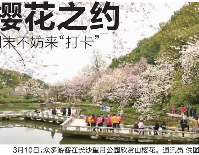
3月10日，众多游客在长沙望月公园欣赏山樱花。

为山樱花、吉野樱、寒绯樱、晚樱等品种，分布在铜盆湖湖畔、玉璧广场、汉乐区附近。目前望月公园内开得最盛的是山樱花。随着气温逐渐升高，公园内其他品种的樱花也将陆续开放。 为呈现更好的樱花景观，望月公园针对性地对铜盆湖沿线樱花进行补栽补种，对赏樱密集点增设取景位，让市民游客畅游花海的同时也能感受到园内不一样的“潮”味。 ■文/视频 全媒体记者 周可 实习生 钟佳霖 通讯员 杨运佳