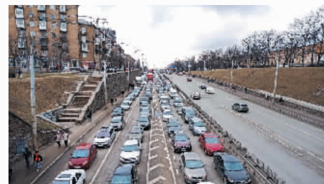
基辅出城方向的车辆排起长龙。