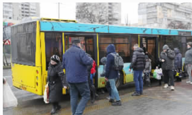
基辅当地居民准备搭乘公交车。