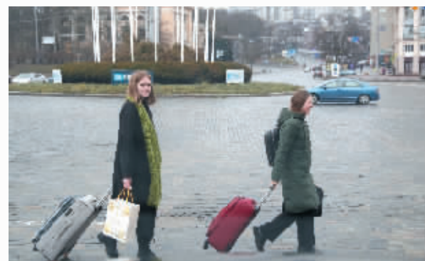
两名女子拉着行李箱走过基辅欧洲广场。