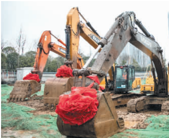
马栏山国际新媒体中心项目开工现场的挖掘机披红带彩。