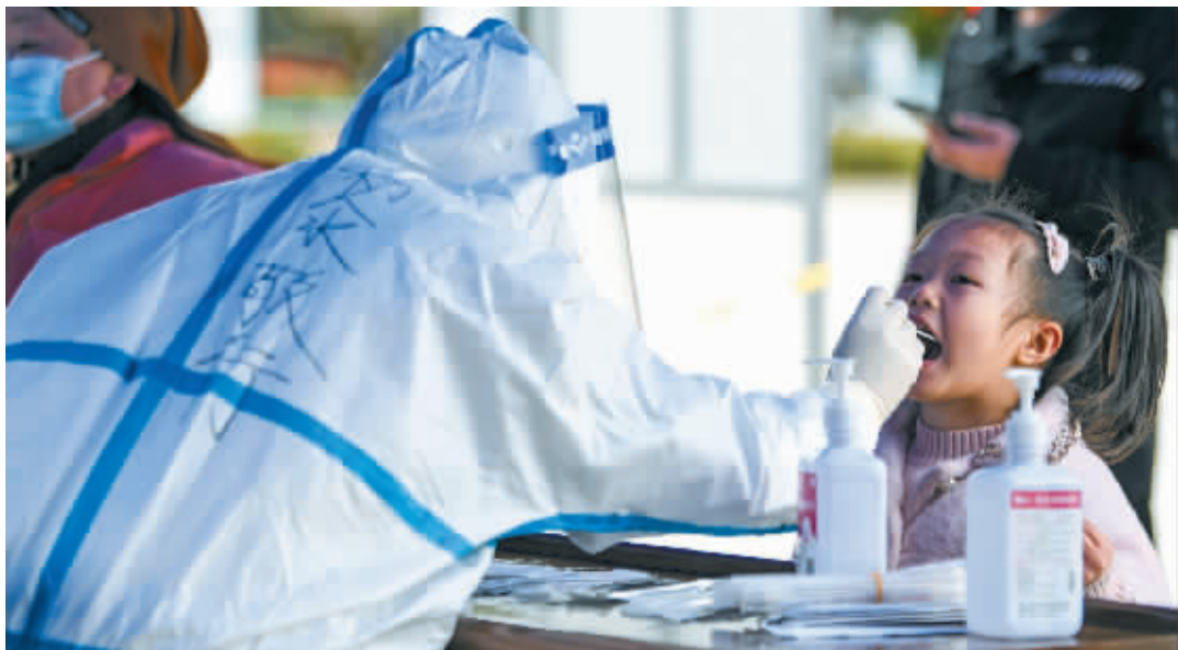
2月9日，在广西百色德保县，工作人员为群众进行核酸采样。