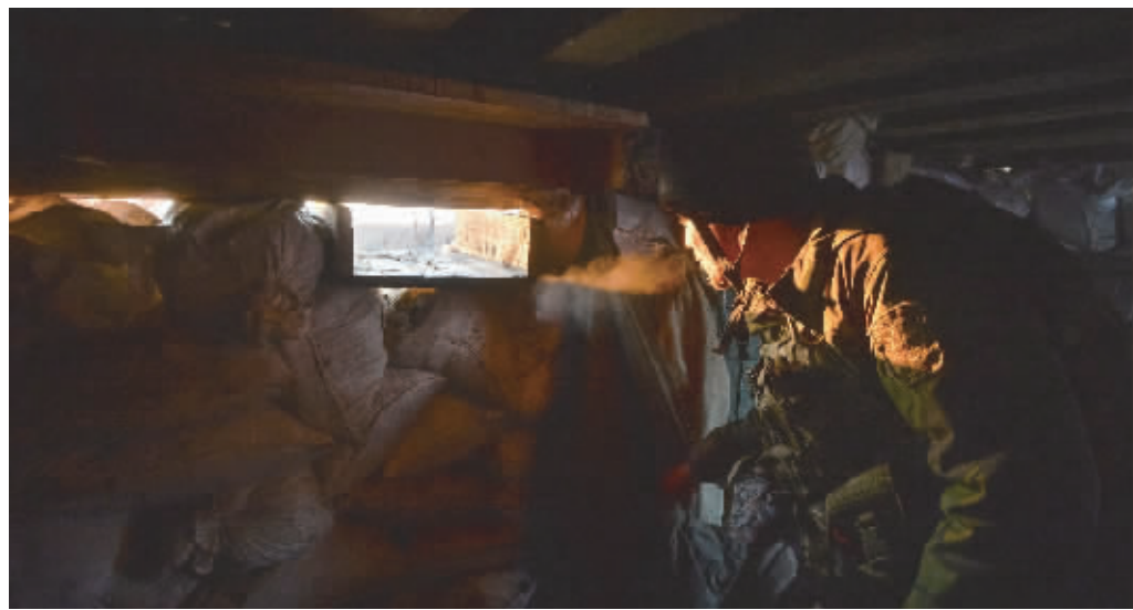
一名乌克兰政府军士兵在乌东部顿涅茨克冲突地区执勤。