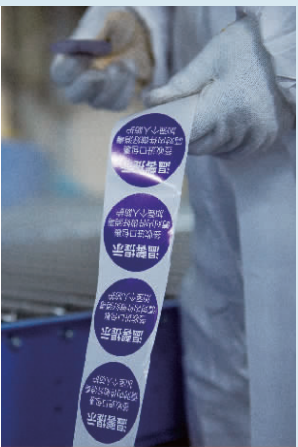
1月21日,在北京市顺义区天竺综合保税区快件中心,联邦快递工作人员准备给境外包裹贴上防疫提示。