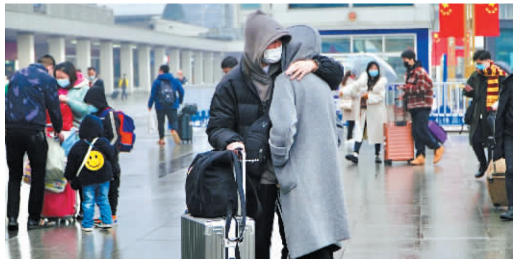
1月17日,长沙火车站迎来众多返乡旅客,铁路部门进入春运模式。