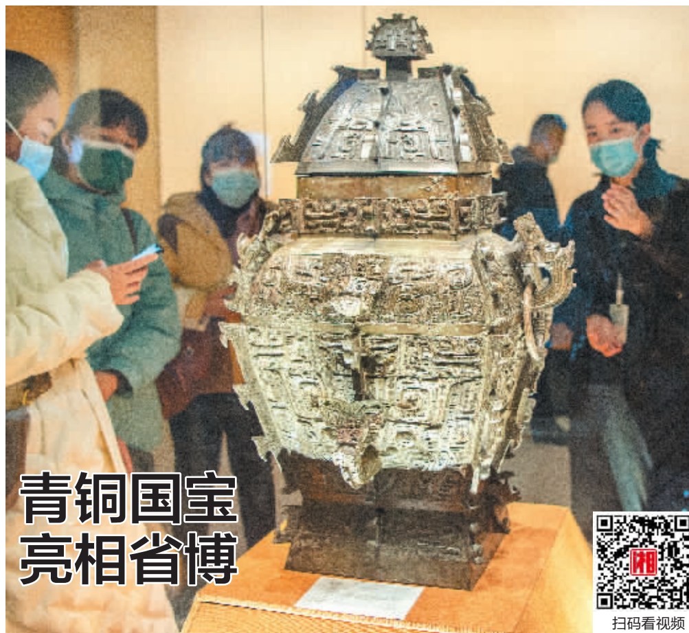
青铜国宝 亮相省博