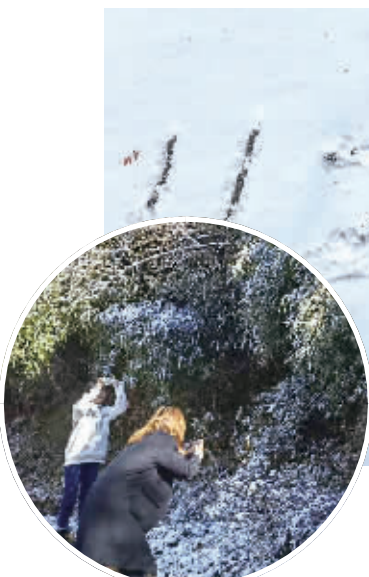
11月22日,浏阳大围山迎来今年冬天首场降雪。