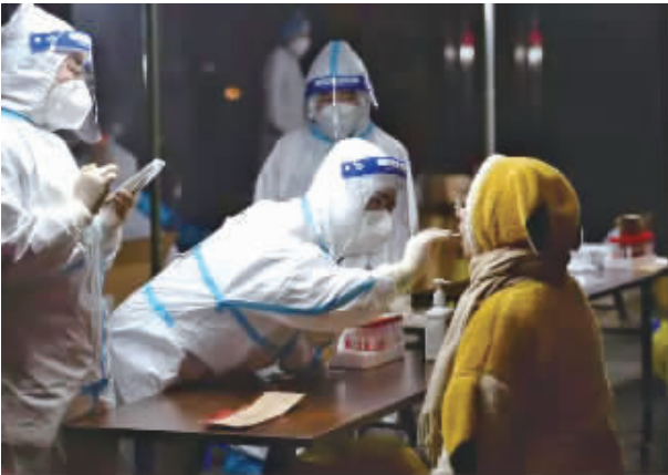
11月8日，成都不少市民都收到小区通知当晚做核酸检测。