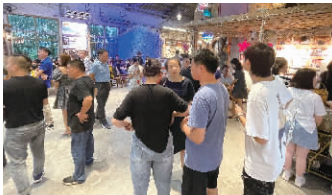
7月6日晚6点，长沙老许家鱼市餐厅满座，不少市民在排队等座。

7月6日晚6点，位于长沙市岳麓区观沙岭的老许家鱼市，这家由老厂房改造而成的餐厅已座无虚席，大批来得较晚的顾客正在等座。“5月4日开业以来，生意一直挺好，每天就餐高峰都要排队。”老许家鱼市相关负责人说。 来自湖南省商务厅的数据显示，今年1-5月，全省餐饮消费增势向好，基本生活类商品零售额延续稳定增长态势，交通电器设备类商品零售额平稳增长，石油及制品类商品零售额增长加快，居住类消费需求持续释放。与此同时，湖南的对外贸易以及对外经济合作也实现较高增速，航空货运、中欧班列强势增长。 ■记者 潘显璇 李成辉