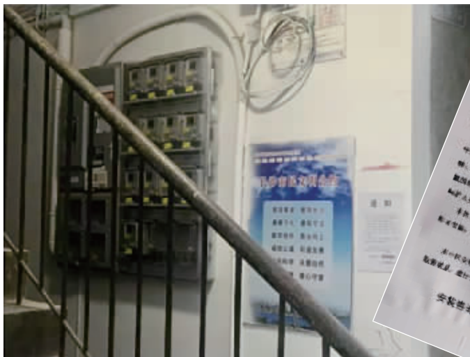
小区楼道内所张贴的推广安装净水器通知。

长沙水业集团同时表示,如果市民对水质有特殊要求,可根据个人习惯安装不同类型的净水器。但净水器在使用中