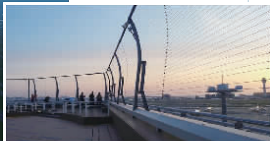
T3航站楼将建设观景平台,旅客可饱览飞行区特色景观。

9月1日,长沙机场改扩建工程总体设计和综合交通接入方案公示。按设计总体规划,长沙机场改扩建工程项目建设内容包括50万平方米的T3航站楼、2.6万平方米的登机桥系统、28.5万平方米的综合交通中心等,远期将建设T4航站楼。