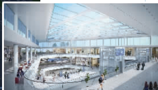
交通中心换乘大厅设计图。