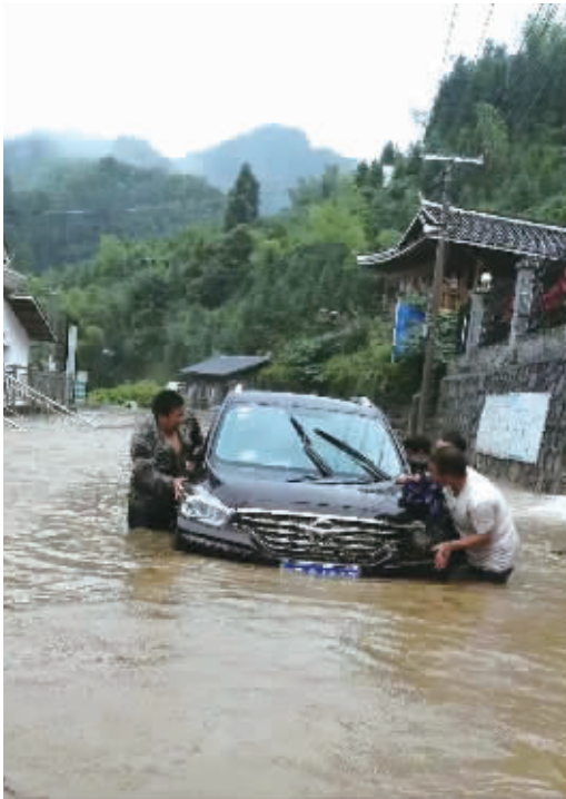
舒炉宝与几名村干部、村民一起解救因洪水被困车内的四人。