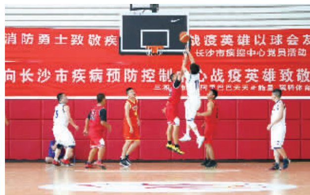
消防勇士与白衣天使球场上激烈比拼。