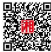
扫码看抗疫英雄 以球会友现场视频