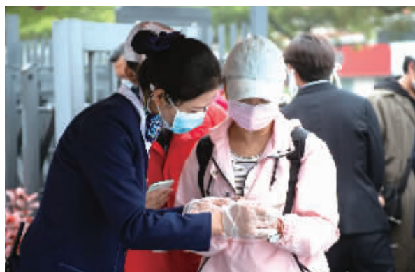
工作人员检查参观者的预约信息。